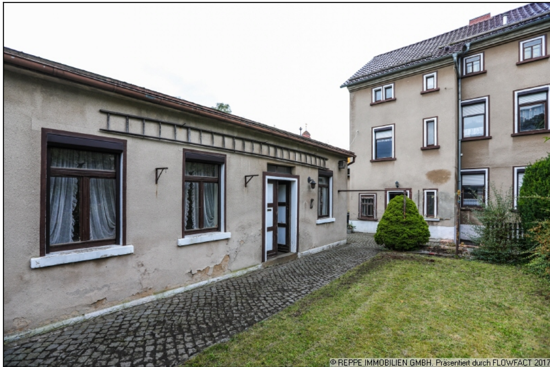
Ansicht mit Nebengebäude